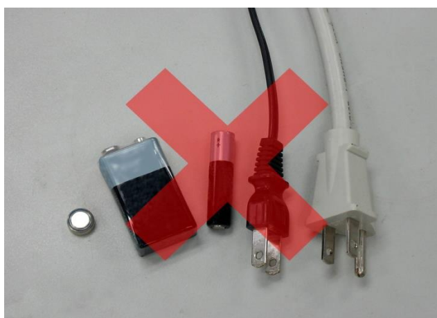
需使用電力的工具